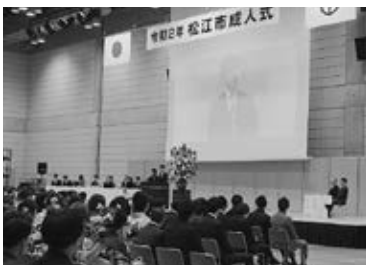
実行委員長挨拶の様子

また、実行委員長として新成人を代表して挨拶をさせていただきましたが、新成人らしい晴れやかな表情をしている方を沢山見かけました。この経験と壇上からの景色は一生忘れられない思い出となりました。