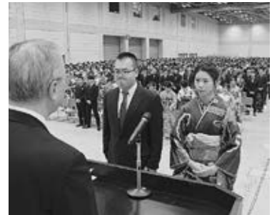
誓いの言葉の様子

今年の成人式は「紡ぎ つむ りなす」という言葉をテーマに、誰もが参加しやすい成人式を目指して実行委員12名で取り組みました。特に今年は昨年度に次年度成人として実行委員に参加していたものが、私を含め4人参加しており、よりスムーズに話し合いが進み、昨年には無かった新しいイベントなどを企画し、バージョンアップした成人式が開催できたのではないかと思います。当日は、1,700人を超える新成人が華やかな晴れ着に身を包み、思い出話に花を咲かせている光景が会場全体に広がっており、この光景を目の当たりにしたとき、成人式を開催する本当の意味を感じとれた気がしました。